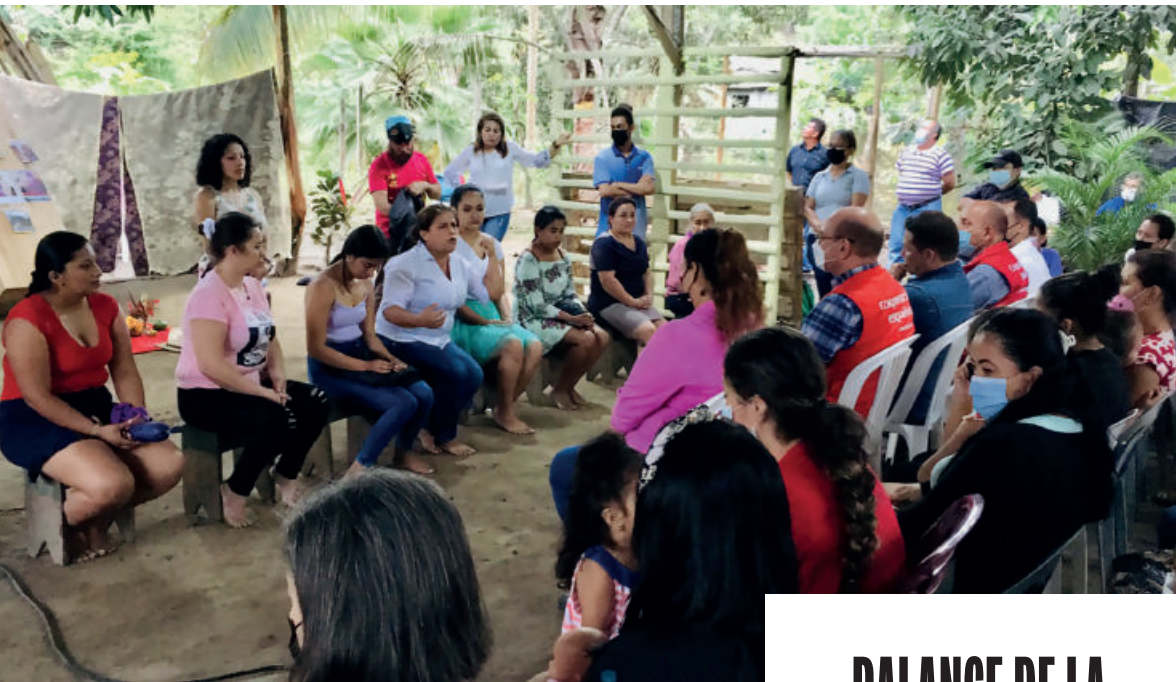
Encuentro de las beneficiarias del Proyecto de Agua potable y Saneamiento para las comunidades rurales dispersas del Cantón de Portoviejo.

Ecuador es uno de los 12 países prioritarios en América Latina y el Caribe para la Cooperación Internacional española. La Agencia Española de Cooperación al Desarrollo (AECID) lleva trabajando en el país más de 30 años habiéndose aumentado