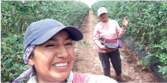
Los beneficiarios del programa de migración circular tendrán mayores facilidades para volver a trabajar en España en el futuro.

Las políticas españolas en torno a la movilidad temporal y circular se apoyan en un marco legal que promueve la contratación en origen como una de las principales vías de acceso de los trabajadores extranjeros al mercado laboral español. En este contexto, la mayor parte de la contratación en origen de los trabajadores temporales se realiza mediante el mecanismo denominado Gestión Colectiva de Contrataciones en Origen (GECCO). En este marco, se vienen produciendo oportunidades de migración regular entre Ecuador y España que están reglamentadas por el Acuerdo entre ambos países de fecha 29 de mayo de 2001 y también por la Orden que se publica cada año para regular la gestión colectiva de contrataciones en origen.