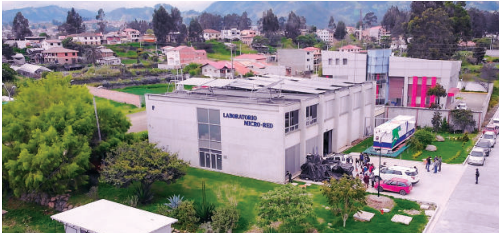
Universidad de Cuenca, Proyecto Micro Red Financiado por el PCDEE.

Si por algo se está caracterizando el año 2022 es por el ánimo de seguir avanzando y pasar la página de crisis mundial originada por la pandemia, a pesar de continuar con desafíos tan relevantes como los efectos de la invasión de Ucrania, que, además de las lamentables consecuencias humanas que está teniendo, genera repercusiones importantes en las cadenas productivas y logísticas.