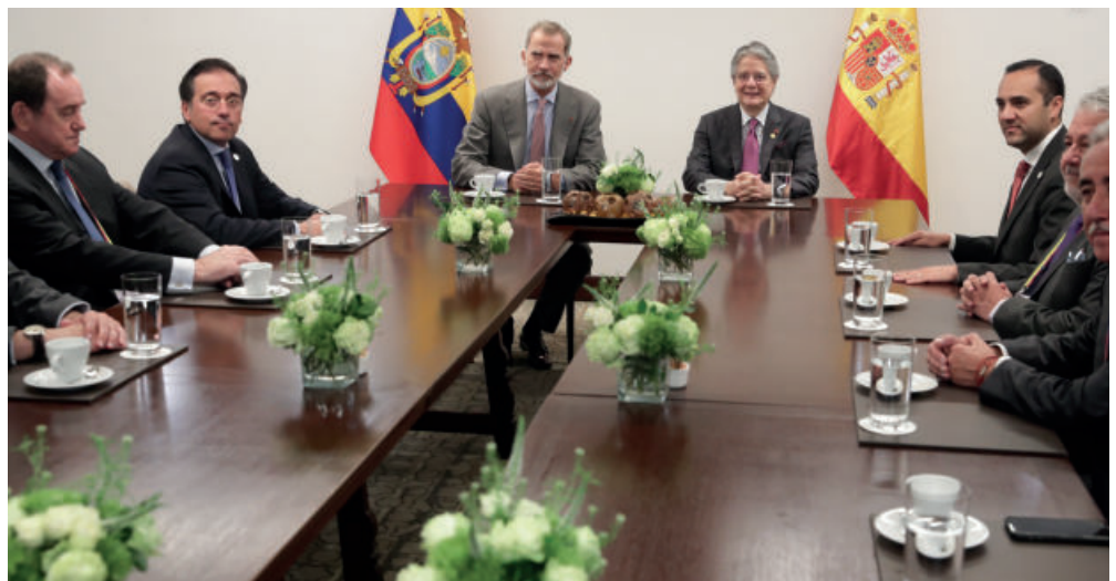
Los jefes de Estado de España y Ecuador reunidos con sus delegaciones.

mismos y a trabajar de la mano de otros; tiempos que también nos traen oportunidades. Felicitamos al Ecuador por su entrada, dentro de unos meses, como miembro no permanente del Consejo de Seguridad de Naciones Unidas, desde donde podrá honrar su trayectoria de defensa de los valores y principios por los que se rigen las Naciones democráticas, solidarias y respetuosas con los derechos humanos, y hacer realidad su objetivo de más Ecuador para el mundo y más mundo para el Ecuador. Felicitamos y agradecemos al Ecuador su compromiso con avanzar y fortalecer ese espacio de encuentro y diálogo a través de las Cumbres Iberoamericanas, cuya Presidencia Pro-tempore recibe Ecuador en 2023.