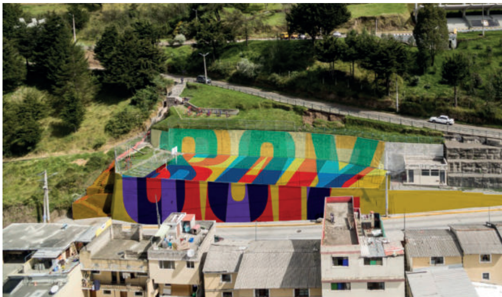
"Soy Raíz" es la obra que el colectivo de arte urbano español realiza en el barrio de La Libertad, escenario de la batalla de Pichincha, en colaboración con los vecinos.

Boa Mistura nació en Madrid en 2001 y tiene más de 10 años de trabajo continuado en toda América Latina. Para su primer trabajo en Ecuador, Boa Mistura ha venido colaborando desde agosto con el Barrio de la Libertad y con colectivos de arte urbano de la ciudad en un trabajo comunitario y de base. Esta segunda intervención, que se inaugurará el 14 de octubre, tiene como objeto reinterpretar un espacio polideportivo de la comunidad de la Libertad. Sus vecinos han contribuido a decidir el diseño y colores de la obra y han pintado junto con Boa Mistura en una minga barrial y festiva a lo largo de tres semanas. Varios colegios, colectivos de arte urbano, artistas, universitarios y pintores se han sumado al esfuerzo. El resultado será la recuperación de un espacio público para la comunidad de la Libertad, fruto del esfuerzo y la ilusión conjunta de españoles y ecuatorianos en un lugar donde hace 200 años una batalla decisiva concluyó que España y Ecuador habían de seguir caminos separados.