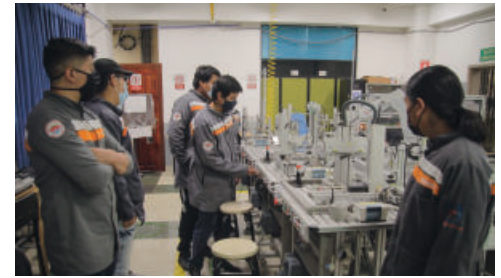
Universidad Técnica del Norte, Proyecto de Mecatrónica financiado por el PCDEE.

Otra partida donde queda patente nuestra relación bilateral es en las remesas. España, con 909,5M$ es el segundo emisor de remesas a Ecuador por detrás de Estados Unidos (2.768M$), pero por delante de Italia (190M$), lo que muestra que muchos trabajadores ecuatorianos confían en España como su lugar de residencia y trabajo, contribuyendo con ello al crecimiento de nuestro país, pero también al de Ecuador a través de estas contribuciones.