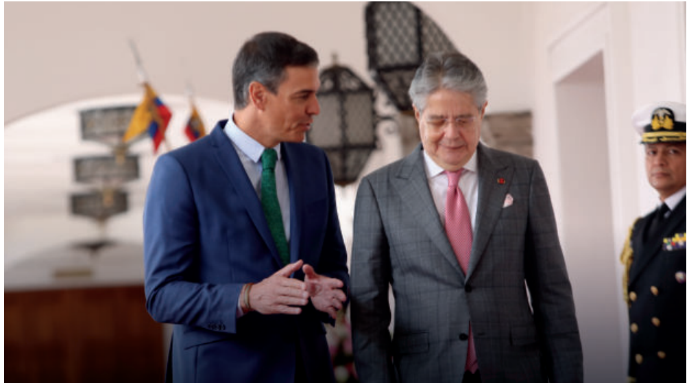
Los Presidentes charlan durante la visita oficial del Presidente Sánchez a Ecuador en agosto de 2022.

En esta nueva convocatoria de la Fiesta Nacional de España me es grato poder abrir las puertas de la Embajada de par en par, tras dos años marcados por el signo de una brutal pandemia, a la que hemos vencido, pero cuyas heridas aún están presentes. No podemos bajar la guardia. Es nuestra responsabilidad encarar los retos que nos traen estos tiempos, con nuevas amenazas y nuevas incertidumbres y de desafíos, como nos muestra la guerra de Ucrania.