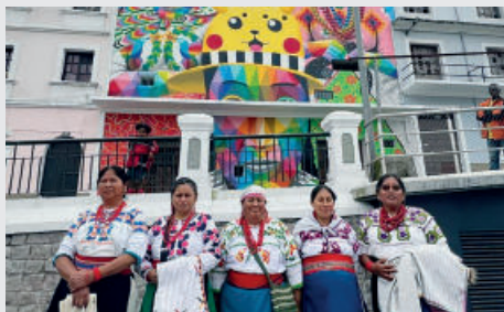
Bordadoras de Llano grande frente al mural de Okuda San Miguel "Las bordadoras del Metaverso".

Hoy son asociaciones compuestas fundamentalmente por mujeres –pero también algunos hombres- las que mantienen vivo el bordado tradicional, como las asociaciones "Sara Sisa" y "Kinti Taller de Bordado" o colectivos de danza como "Sisa Pacari". También en España hay hoy asociaciones de migrantes que mantienen vivo este patrimonio, reuniéndose en el Club Museo a Mano de Madrid, y el Museo del Traje en Madrid recibió hace unos años la muestra Camisa de Llano Grande – Proyección Estética.