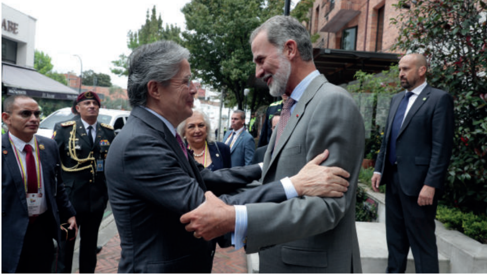
Encuentro del Presidente Lasso y S.M. el Rey Felipe VI en Bogotá durante la toma de posesión del Presidente colombiano.

Ecuador y España de fomentar el desarrollo económico y social del país a través de programas de inversión pública con alto impacto: desde la universalización de la educación básica, la capacitación de profesores, la mejora de infraestructuras educativas, el equipamiento de laboratorios de investigación científica en universidades e institutos técnicos superiores, o la reconstrucción y equipamiento de 43 centros de salud afectados por el terremoto de 2016 en la provincia Manabí. Nos enorgullece que todos estos proyectos hayan ayudado a contribuir a la mejora de la calidad de vida sobre todo de niños y jóvenes, con mejor sanidad y mejores oportunidades educativas; y también a los ciudadanos ecuatorianos en general, que, por ejemplo, por el click de sus dispositivos móviles reciben en tiempo real alertas tempranas de movimientos sísmicos o volcánicos en el país desde el Instituto Geofísico de Quito.